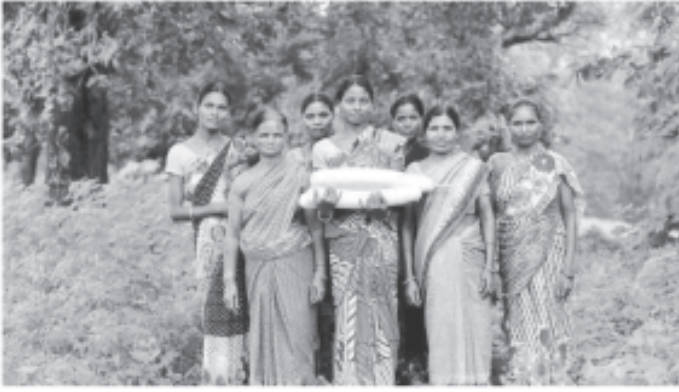
సేంద్రియ వ్యవసాయం గురించి చర్చిస్తున్న గిరిజన మహిళలు