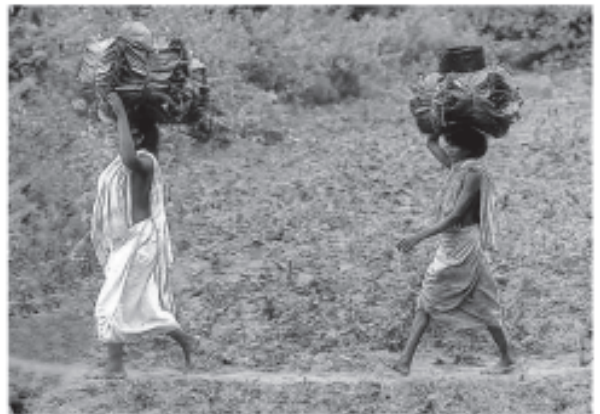
ఒడిసా డోంగ్రియా కందా గిరిజన తెగకు చెందిన మహిళ వివిధ ఆర్థిక కార్యకలాపాలలో పాల్గొనుట