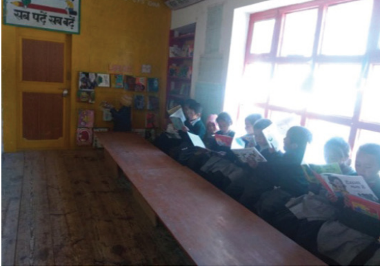
अध्ययन अध्यापन साहित्य व कृतीखोली