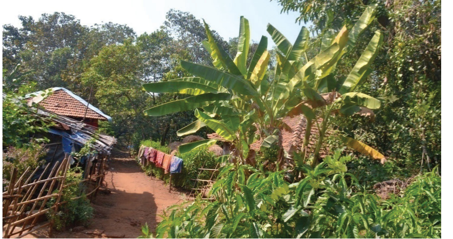
जिल्हा परिषद आदर्श शाळा, निवळी