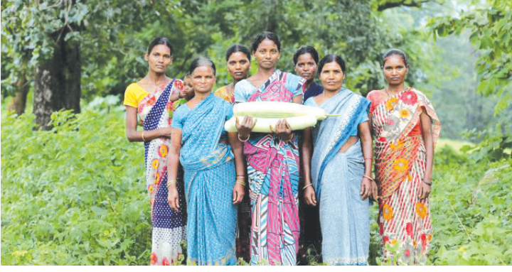
आदिवासी महिला सेंद्रिय शेतीमध्ये रूपांतर घडविताना