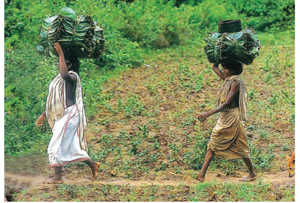
ఒరిస్సాలోని దోణగిరి కందాలోని వైవిధ్యభరితమైన ఆర్థిక కార్యకలాపాలు